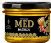
Včelí med so šípkou (250g)