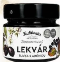
Lekvár slivka s aróniou (200g)