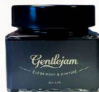
Čučoriedkový džem s portským vínom (250g)