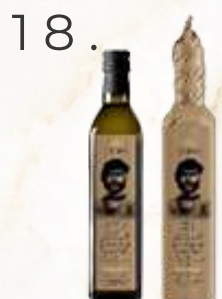
Maraska E.P.O.O. (500ml)