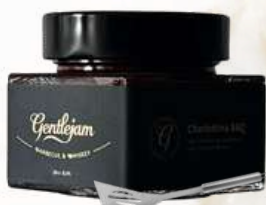
Barbecue omáčka s rašelinovou whiskey (250g)