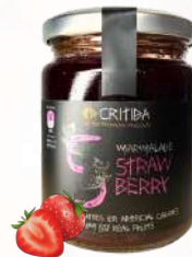
Marmeláda jahoda (300g)