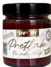
Pretlak zo slovenských paradajok (200g)