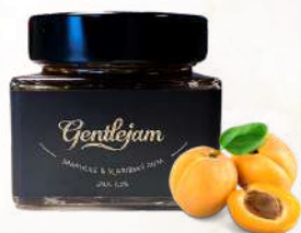
Marhuľový džem s karibským rumom (250g)