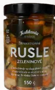
Zeleninové rusle (550g)