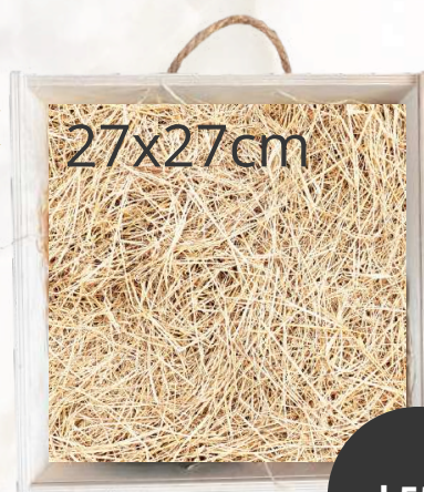
Mini 2 box