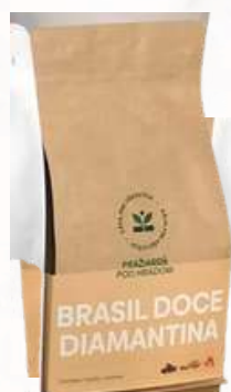
Káva Brasil Doce Diamantina čokoláda / oriešky / karamel (200g, 500g)

Veľkosť kávy dodávame v 200 g alebo 500 g baleniach.