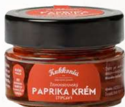
Paprikový krem pálivý (250g)