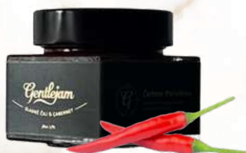
Sladká čili paradajková omáčka s Cabernetom (250g)