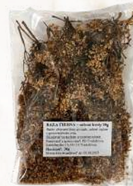
Baza čierna sušené kvety (30g)