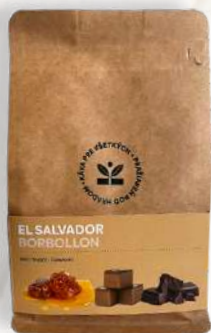
Káva El Salvador Borbollon med / nugát / čokoláda (200g, 500g)