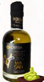
Wasabi E.V.O.O. (200ml)