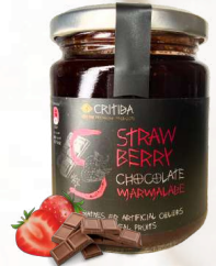
Marmeláda - jahoda, čokoláda (300g)