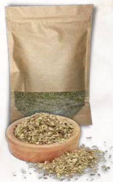
Sušené oregáno (50g)