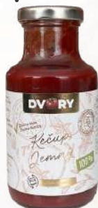
Kečup jemný (250g)