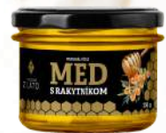
Včelí med s bio rakytníkom (250g)