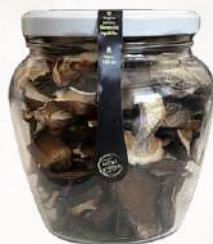
Sušené dubáky, kozáky (550ml)