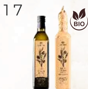
BIO Maraska E.P.O.O. (500ml)