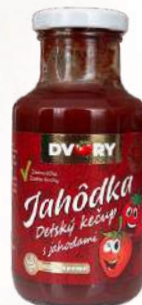
Detský kečup s jahodami (250g)