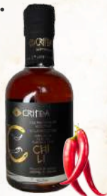
Chili E.V.O.O. (200ml)