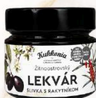
Lekvár slivka s rakytníkom (200g)