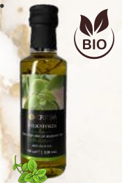
BIO Oregánový E.P.O.O. (100ml)