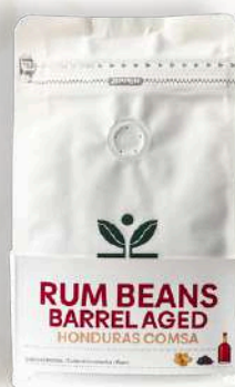
Káva Honduras Comsa Rum Beans Barrel Aged cukrová trstina / sušené hrozienka / rum (200g, 500g)