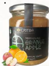
Marmeláda - jablko, pomaranč (300g)