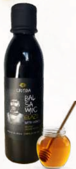
Balzamikové glazé medové (250ml)