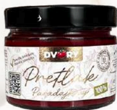
Pretlak zo slovenských paradajok (300g)