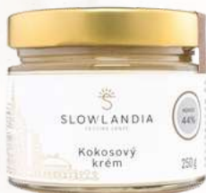
Kokosový krém (250g)