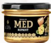
Včelí med repkový (250g)