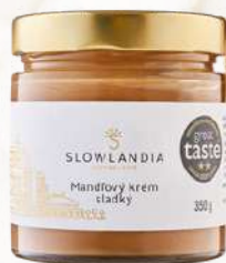
Mandľový krém sladký (350g)