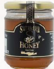
Med Sarakina tymiánový (230g)