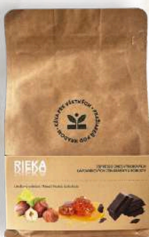
Káva RIEKA - 70% arabika 30% robusta horká čokoláda / lieskový oriešok / med (200g, 500g)