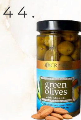
Zelené olivy s mandľou, (500g)