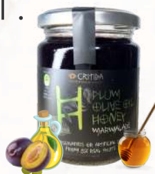
Marmeláda - slivka, olivový olej, med (300g)