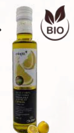
BIO Citrónový E.P.O.O. (250ml)