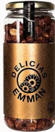
Arašidy v karameli (400g)