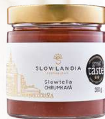
Slowtella chrumková (300g)