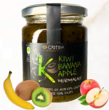
Marmeláda - kiwi, jablko, banán (300g)