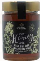
Med Critida Borovicovo tymiánový (430g)