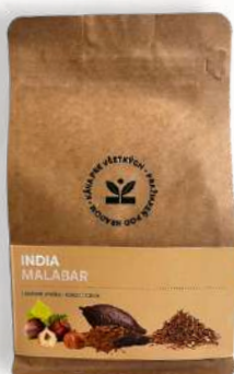
Káva India Malabar lieskový oriešok / kakao / tabak (200g, 500g)