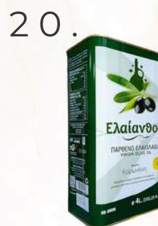
Sarakina Eleanthos Koronaiki P.O.O. (4l)