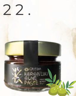
Olivová pasta Koroneiki (125g)