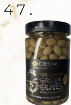
Mini krétske zelené olivy (380g)