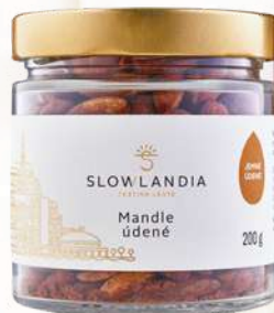
Mandle údené (200g)