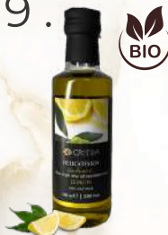
BIO Citrónový E.P.O.O. (100ml)