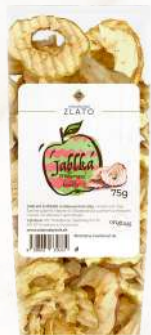
Vrúbkované sušené jablká, chrumkavé (75g)