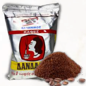
Krétska Nr.1 káva (200g)