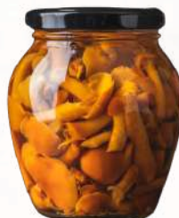
Zavárane dubáky, kozáky (550ml, 314ml)