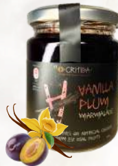
Marmeláda - slivky, vanilka (300g)