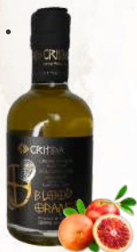
Pomarančový E.P.O.O. (200ml)