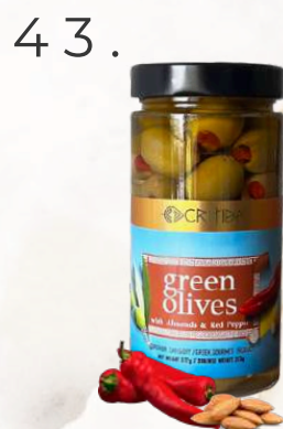
Zelené olivy s mandľou a červenou paprikou, (500g)