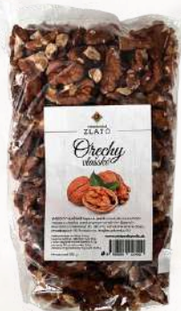
Vlašské orechy (350g + rôzne)