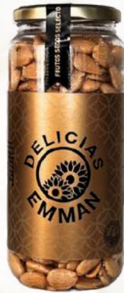
Pražené mandle solené (440g)