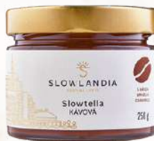
Slowtella Kávová (250g)