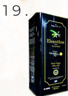
Sarakina Eleanthos Koronaiki premium E.P.O.O. (5l)