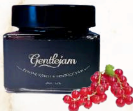
Džem z červených ríbezlí a Hendrick's ginom (250g)