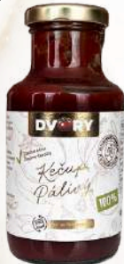
Kečup páľivý (250g)