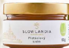
Pistáciový krém (150g)