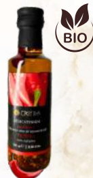
BIO Paprikový E.P.O.O. (100ml)