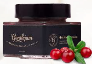
Brusnicová omáčka s gaštanmi a 6-putňovým vínom (250g)