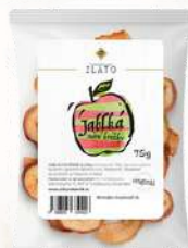
Sušené jablká, chipsy (40g)