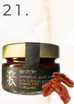
Olivová pasta koroneiki so sušenými paradajkami, vínom, oreganom (125g)