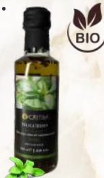
BIO Bazalkový E.P.O.O. (100ml)