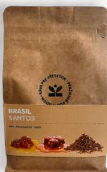
Káva Brasil Santos med / slaný karamel / tabak (200g, 500g)