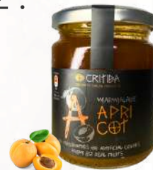
Marmeláda marhuľa (300g)