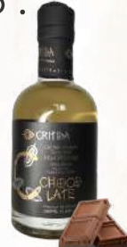
Čokoládový E.V.O.O. (200ml)