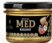
Včelí med kvetový (250g)