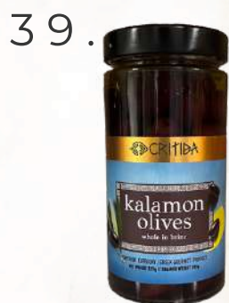
Olivy Kalamon (500g)