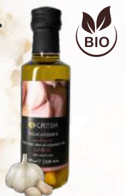
BIO Cesnakový E.P.O.O. (100ml)