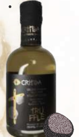
Hľuzovkový E.V.O.O. (200ml)