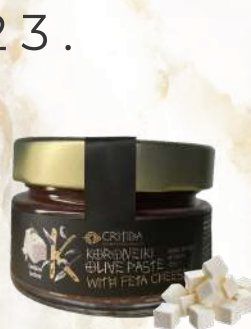
Olivová pasta koroneiki so sušenými paradajkami, vínom, oreganom (125g)