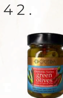
Chalkidiki olivy s piri-piri, (345g)