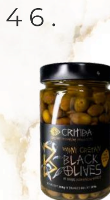
Mini krétske čierne olivy (380g)