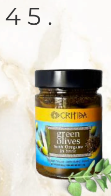
Zelené olivy s oregánom (345g)