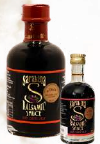
Balsamiko Sarakina (200ml, 50ml)