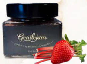
Jahodový džem s rebarborou a Jack Daniels Single Barrel whisky (250g)