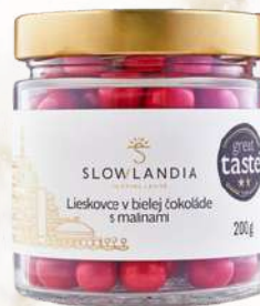
Lieskovce v bielej čokoláde s malinami (200g)